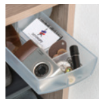
小物収納に便利な 回転トレーをセットアップ。

下部は樹脂棚板メインのシューズ収納に特化したプラン。 上部に木質棚板をセットし、おしゃれグッズや通勤時に読みたい本などを収納。 仕切板を境に分け、レディースとメンズでゾーニング収納。 レディースゾーンには、ブーツハンガーをセットして機能的な収納プランにできます。